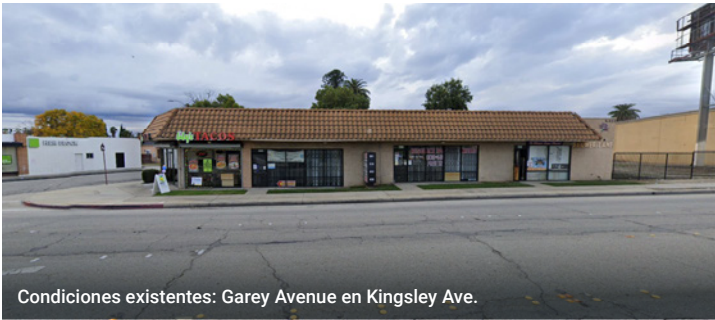
Condiciones existentes: Garey Avenue en Kingsley Ave.