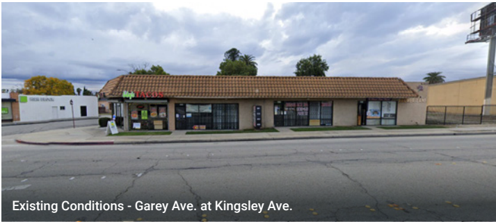
Existing Conditions - Garey Ave. at Kingsley Ave.