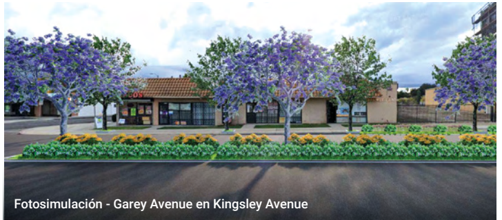
Fotosimulación - Garey Avenue en Kingsley Avenue