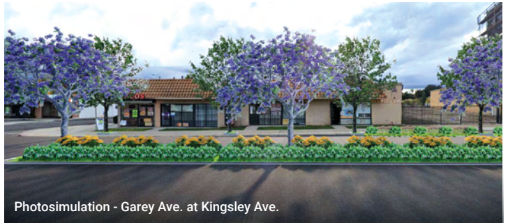
Photosimulation - Garey Ave. at Kingsley Ave.